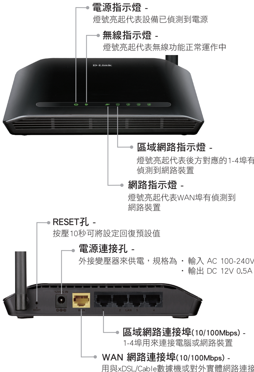
DIR-600M 無線路由器 快速安裝手冊